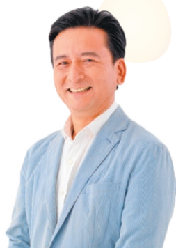
佐賀県知事 山口 祥義 よしのり

佐賀県のいろいろな場所に出かけ、子どもたちと過ごすかけがえのない時間を、存分に楽しんでください!