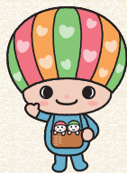
佐賀県子育て応援キャラクター 「さがっぴい」