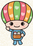
佐賀県子育て応援キャラクター 「さがっぴい」